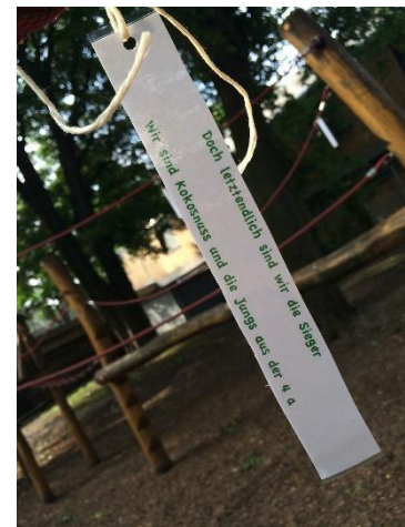
Abbildung 7

Nach dem Picknick treffen sich die Schüler im Sitzkreis und als Einstieg auf die dritte Station lauschen sie einer weiteren Vorlesesequenz 45 . Ein Schüler der Gruppe liest den Text laut vor. Ist dieser fertig, springt der „Tiger“ plötzlich in den Klettergarten. Dies wird von einer Tonaufnahme eines Tigerbrüllens 46 untermalt, um Spannung zu erzeugen. Die Schüler erhalten die Anweisung zum Klettergartenbau zu flüchten. Dort wird ihnen die nächste Aufgabe erläutert.