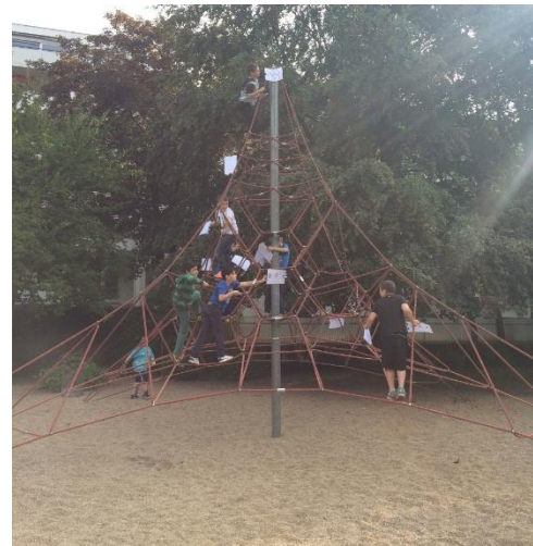
Abbildung 18

Als dann die erste Lesesequenz zu Ende war, waren die Jungen kaum mehr zu halten. Sie liefen auf die Kletterspinne zu und fingen an die Blätter abzuhängen. Nur ein Junge blieb unten stehen – er hatte sich vor kurzem die Hand gebrochen und konnte nicht klettern. Da wir diese Situation vorhergesehen hatten, oder aber auch, dass ein Kind nicht klettern wollte, war es ihm möglich auch von unten aus dem Stand ein Blatt abzuhängen. Uns war es wichtig, dass jeder Junge mindestens ein Blatt mit zurück in den Sitzkreis brachte, damit er dieses an ein weiteres andocken und vorlesen konnte.