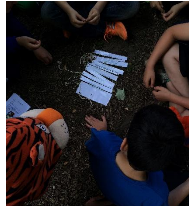
Abbildung 23 Copyright by Frank Reifenberg

sich dann aber sehr liebevoll und ermutigend um den Jungen gekümmert, sodass er schnell wieder zu den anderen Jungen zurück gegangen ist. Während dieser unangenehmen Situation und auch um von der Aktion ein wenig abzulenken, bekam der Junge mit der gebrochenen Hand den Auftrag, schnell unter dem Kletterwald auf die andere Seite zu rennen, ohne von dem Tiger geschnappt zu werden. Das hat auch sehr gut geklappt. Daraufhin wollte der andere Junge, der Höhenangst hatte, trotz seiner Angst probieren, den Kletterwald zu überwinden. Auf seinem Weg wurde er von seinen Mitschülern angefeuert, eine Studentin hat ihn begleitet, ermutigt und bei kritischen Stellen ihre Hand als Hilfe angeboten. Letztendlich hat dieser Schüler es tatsächlich geschafft. Er ist stolz, mit leuchtenden Augen, bei den anderen Jungen angekommen.